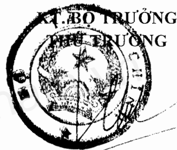
Trần Văn Hiếu

3. Trong trường hợp có những quy định của pháp luật có liên quan đến hoạt động của DATC chưa được quy định tại Điều lệ hoặc trong trường hợp có những quy định mới của pháp luật khác với những điều khoản trong Điều lệ thì những quy định của pháp luật đó được áp dụng để điều chỉnh hoạt động của DATC./.