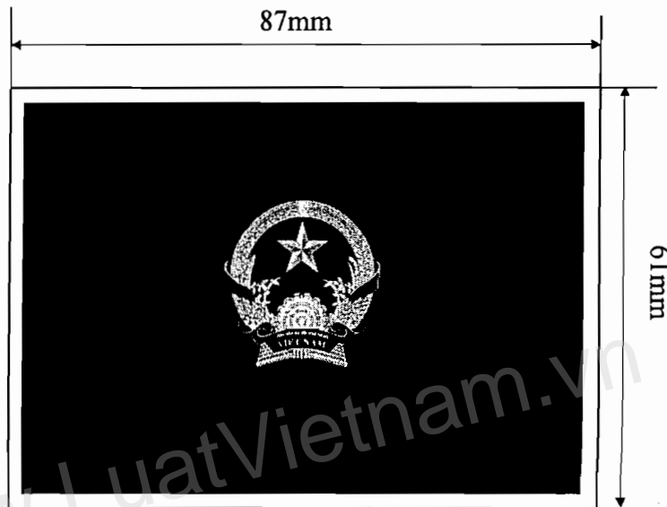
Hình 2. Mặt sau