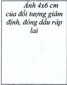
Ảnh 4x6 cm của đối tượng giám định, đóng dấu ráp lại