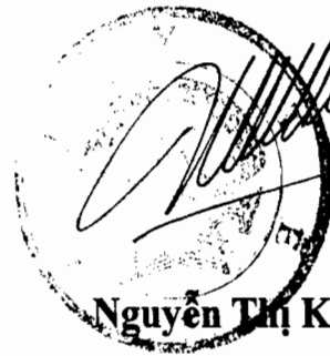
Nguyễn Thị Kim Tiên