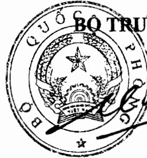
Đại tướng Ngô Xuân Lịch