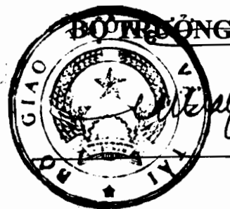
Đinh La Thăng