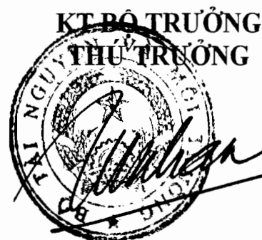
Võ Tuấn Nhân