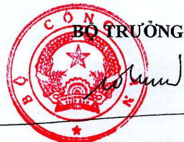
Đại tướng Tô Lâm