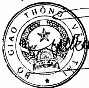
Đinh La Thăng