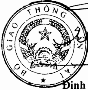
Đinh La Thăng