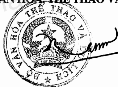
Nguyễn Ngọc Thiện

BỘ TRƯỞNG BỘ VĂN HÓA, THỂ THAO VÀ DU LỊCH