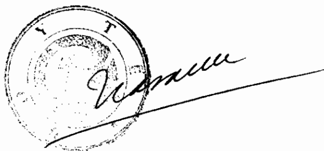
Nguyễn Quốc Triệu