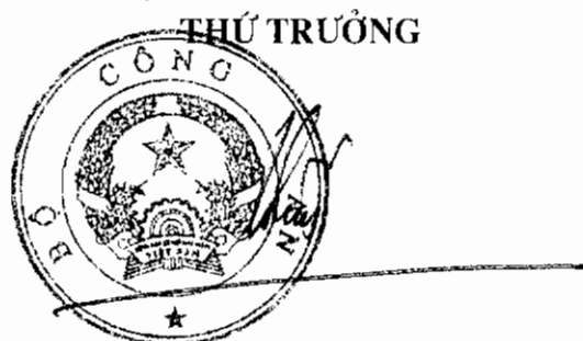
Trung tướng Đặng Văn Hiếu