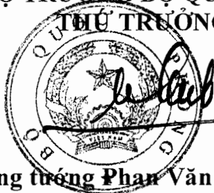
Trung tướng Phan Văn Giang