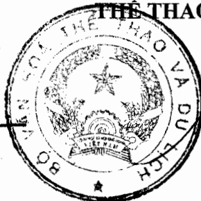
Hoàng Tuấn Anh

BỘ TRƯỞNG BỘ VĂN HÓA, THỂ THAO VÀ DU LỊCH