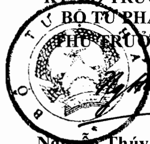
Nguyễn Thúy Hiền