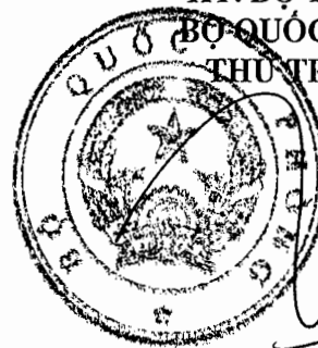
Thượng tướng Lê Chiêm