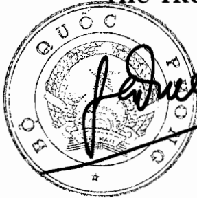
Thượng tướng Lê Hữu Đức