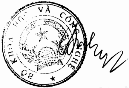
Chu Ngọc Anh

KT. BỘ TRƯỞNG BỘ KHOA HỌC VÀ CÔNG NGHỆ THỦ TRƯỞNG