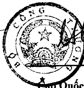
Cao Quốc Hưng