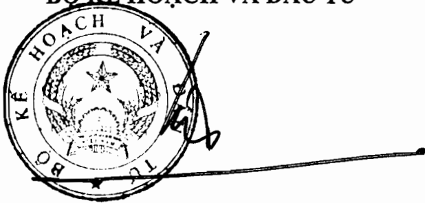
Bùi Quang Vinh

BỘ TRƯỞNG BỘ NÔNG NGHIỆP VÀ PHÁT TRIỂN NÔNG THÔN