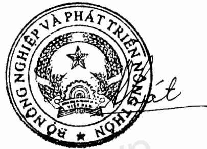
Cao Đức Phát

BỘ TRƯỞNG BỘ NÔNG NGHIỆP VÀ PHÁT TRIỂN NÔNG THÔN