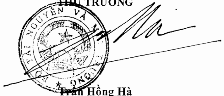
Trần Hồng Hà

KT. BỘ TRƯỞNG BỘ TÀI NGUYÊN VÀ MÔI TRƯỜNG THỦ TRƯỞNG