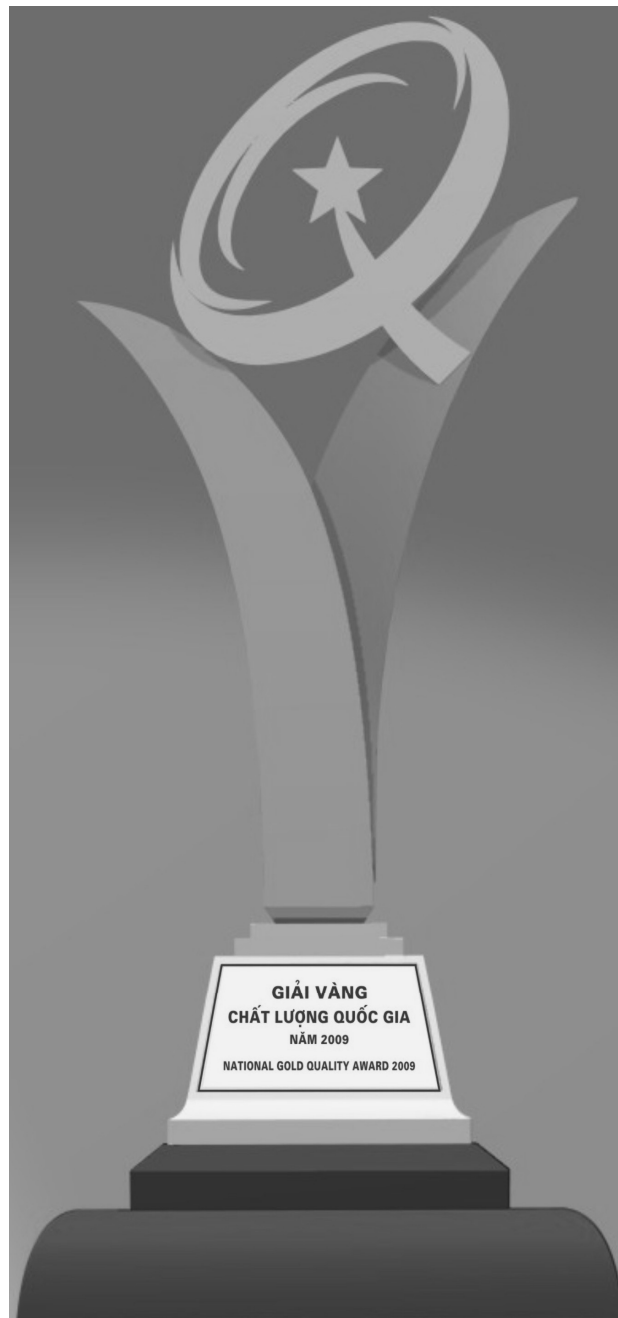
Hình 1. Hình dạng Cúp Vàng Giải thưởng Chất lượng Quốc gia