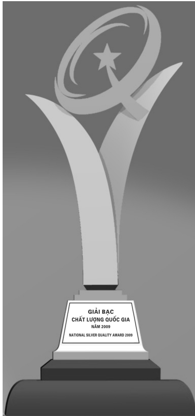
Hình 2. Hình dạng Cúp Bạc Giải thưởng Chất lượng Quốc gia