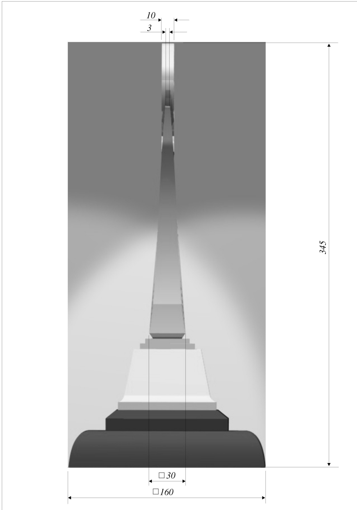
Hình 4. Kích thước mặt bên của Cúp Giải thưởng Chất lượng Quốc gia