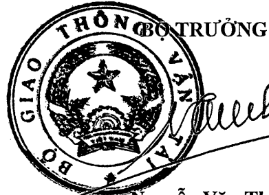
Nguyễn Văn Thế

8 Điều 2 và Điều 3 của Thông tư số 49/2018/TT-BGTVT sửa đổi, bổ sung một số điều của Thông tư số 35/2012/TT-BGTVT ngày 6 tháng 9 năm 2012 của Bộ trưởng Bộ Giao thông vận tải quy định về lắp đặt báo hiệu kilômét - địa danh và cách ghi ký hiệu, số thứ tự trên báo hiệu đường thủy nội địa, có hiệu lực kể từ ngày 01 tháng 01 năm 2019 quy định như sau: