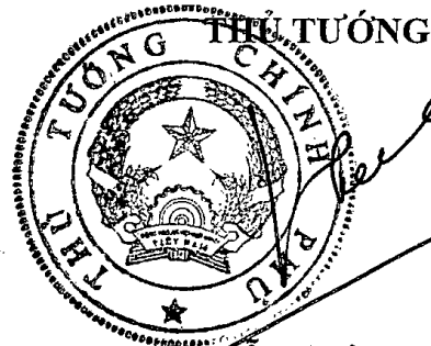
Nguyễn Xuân Phúc

4. Trong quá trình tổ chức thực hiện Kế hoạch, nếu có khó khăn, vướng mắc, đề nghị các bộ, ban, ngành, địa phương phản ánh về Bộ Công an để được hướng dẫn./