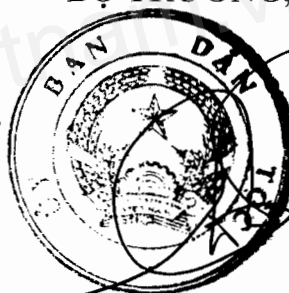
Giàng Seo Phử