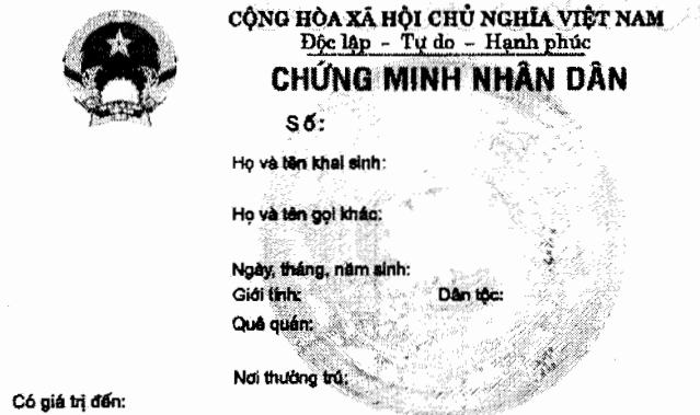
Hình 1 – Mặt trước.

minh nhân dân cỡ 20 x 30 mm; có giá trị đến (ngày, tháng, năm). Bên phải, từ trên xuống: Cộng hoà xã hội chủ nghĩa Việt Nam, Độc lập - Tự do - Hạnh phúc; chữ “Chứng minh nhân dân”; số; họ và tên khai sinh; họ và tên gọi khác; ngày, tháng, năm sinh; giới tính; dân tộc; quê quán; nơi thường trú.