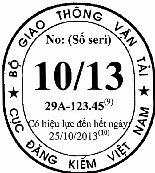
Tem kiểm định cho xe cơ giới