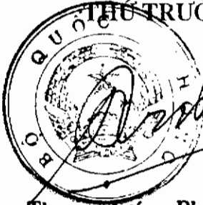
Thượng tướng Phan Trung Kiên