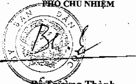
Bê Trường Thành

KT. BỘ TRƯỞNG, CHỦ NHIỆM ỦY BAN DÂN TỘC PHÓ CHỦ NHIỆM