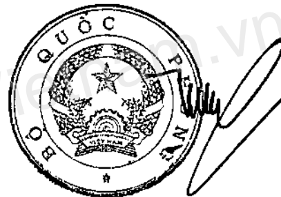
Đại tướng Phùng Quang Thanh