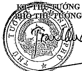
Trần Lưu Quang