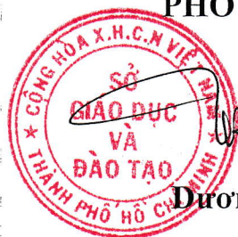
Dương Trí Dũng