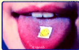
“Tem giấy”, “Bùa lưỡi” (có tẩm chất ma túy LSD):

TRÊN CÁC NHÃN MẮC SẢN PHẨM ĐA SỐ ĐỀU CÓ LOGO NHẬN DIỆN HÌNH ẢNH LÁ, CÂY CẦN SA