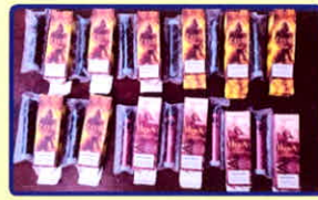
Thuốc lá điện tử có chứa chất ma túy