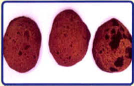
Bánh quy cần sa

Được làm từ nguyên liệu các dạng bánh quy trộn lẫn “bơ cần sa”, socola trộn “bơ cần sa”, (lá cần sa tươi hoặc khô trộn, chế biến cùng bơ thực phẩm)