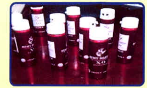
Nước “Vui” có chứa chất ma túy

Các loại nước uống, nước ngọt có chứa chất ma túy