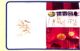
Trà sữa có chứa chất ma túy

Các loại nước uống, nước ngọt có chứa chất ma túy