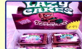
Bánh lười “Lazy Cakes”

Được làm từ chất cần sa tươi hoặc khô trộn, chế biến cùng nguyên liệu làm kẹo.