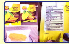
Nước “Xoài” có chứa chất ma túy