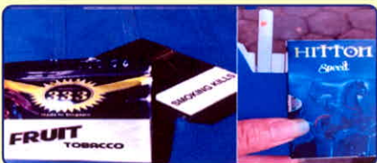
Thuốc lá điếu, thuốc lá TOBACO