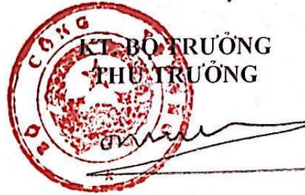
Đỗ Thắng Hải