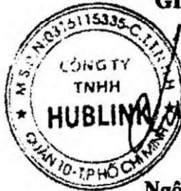
Ngô Quốc Phú