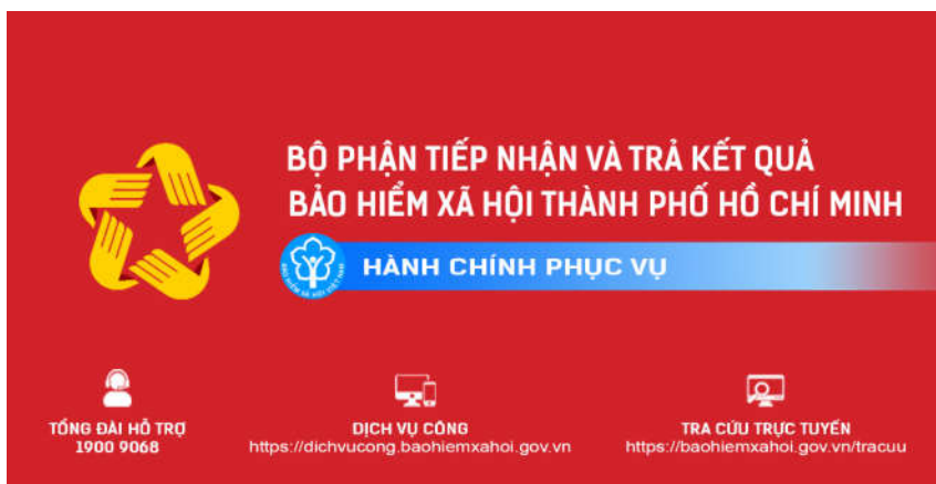
Hình 2: Biển vẫy ngang