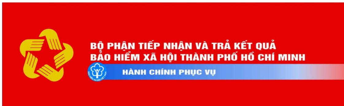
Hình 1: Bảng hiệu ngang

Thông số thiết kế theo tài liệu hướng dẫn: Kích thước 600 x 150 cm; kích thước của Logo là 110 x 110 cm, cách các lề trên dưới 20 cm; trường hợp lựa chọn kích thước khác phù hợp với trụ sở Bộ phận một cửa của đơn vị cần bảo đảm tỷ lệ, bố cục cân đối.