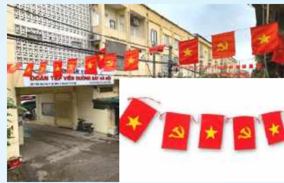
Hình 16b (cờ dây)