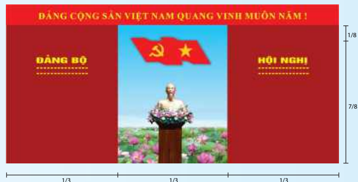
Hình 4a (kích thước hội trường rộng)