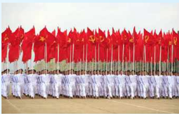
Hình 24b (rước theo hàng)