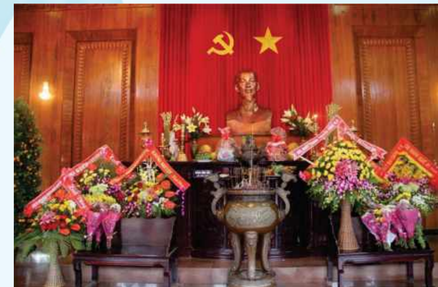
Hình 21c - Trong đền thờ chính