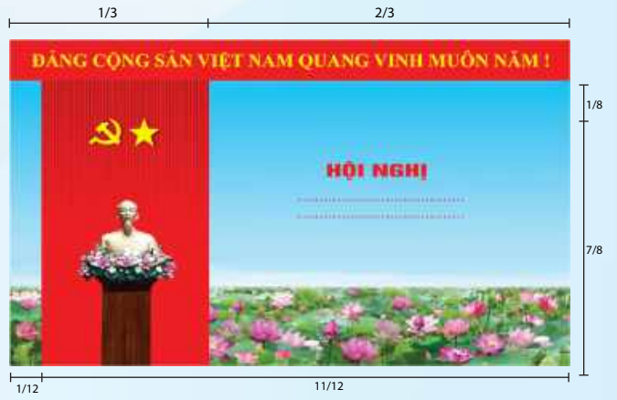
Hình 5a (cờ xếp dọc)