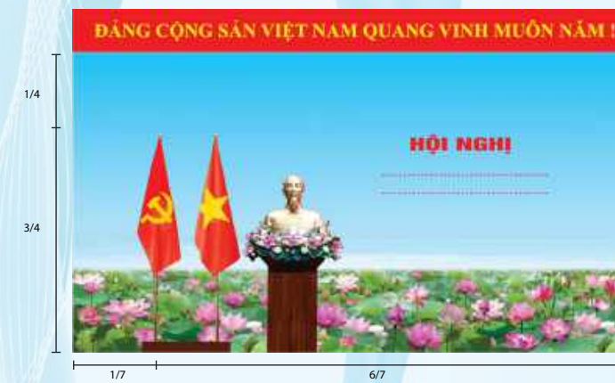
Hình 2 (Cờ có cán)

Điều 5. Trang trí khánh tiết hội trường, phòng họp, phòng tiếp khách, phòng truyền thống và khuôn viên của cơ quan, đơn vị