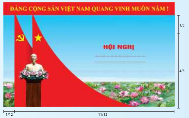
Hình 5c (cờ xếp chéo đôi)