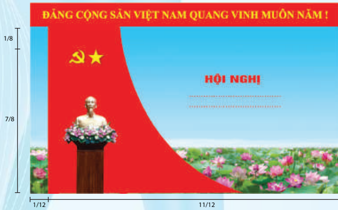
Hình 5b (cờ xếp chéo đơn)