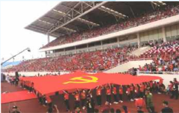
Hình 24a (rước cờ vai)