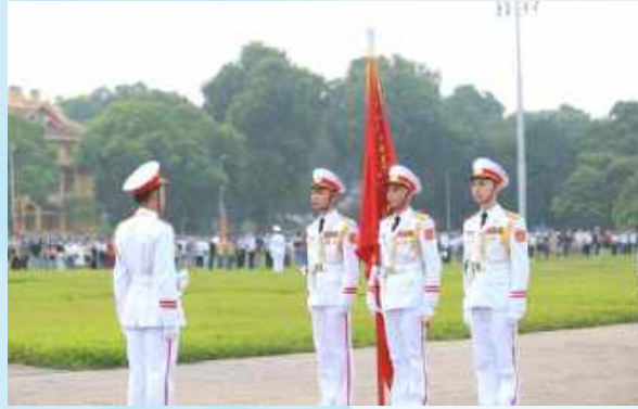
Hình 23a (cầm cờ)