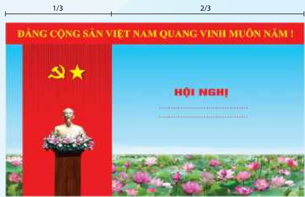
Hình 5a (cờ xếp dọc)