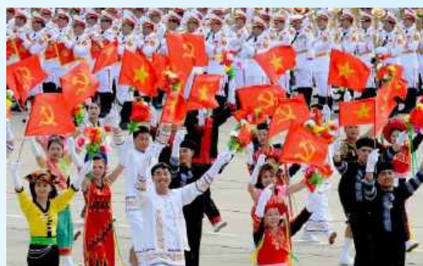
Hình 23d (vẫy bằng tay)