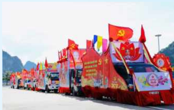
Hình 24d (rước bằng xe)