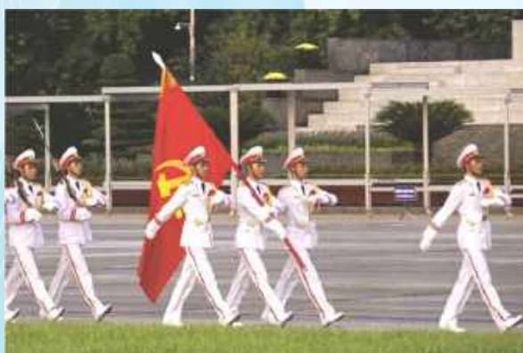
Hình 23c (vác cờ)