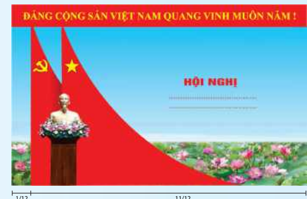
Hình 5c (cờ xếp chéo đôi)