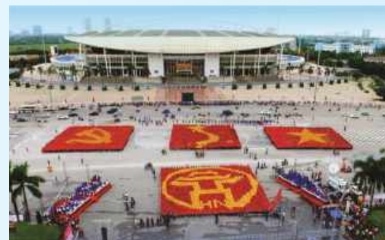
Hình 32 (xếp bằng người)