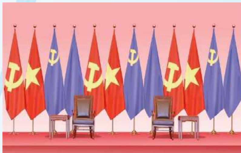
Hình 22 - (2 cờ màu tím là minh họa cờ Đảng và Quốc kỳ nước khách)

Điều 12. Nơi tổ chức các hoạt động đối ngoại đảng, ngoại giao nhà nước