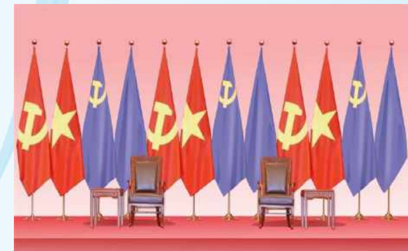
Hình 22 - (2 cờ màu tím là minh họa cờ Đảng và Quốc kỳ nước khách)