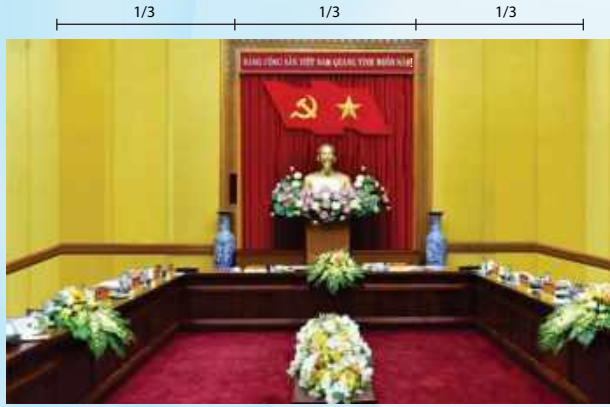
Hình 4b (kích thước hội trường nhỏ)