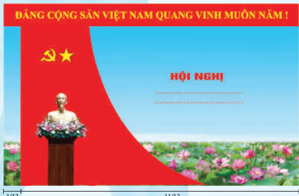
Hình 5b (cờ xếp chéo đơn)