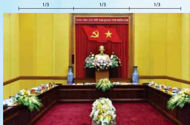
Hình 4b (kích thước hội trường nhỏ)