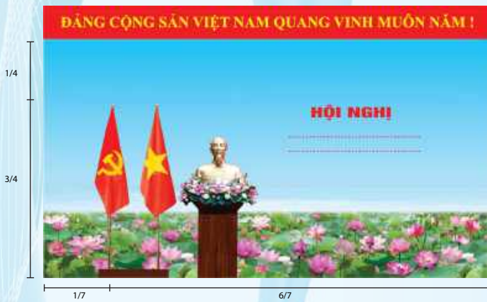
Hình 2 (Cờ có cán)