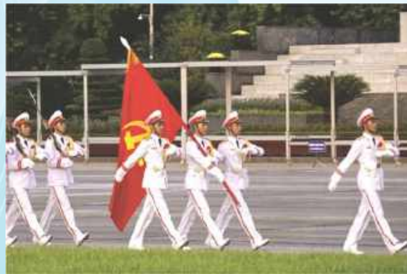
Hình 23c (vác cờ)