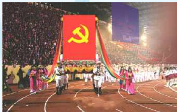
Hình 24c (rước trên kiệu)