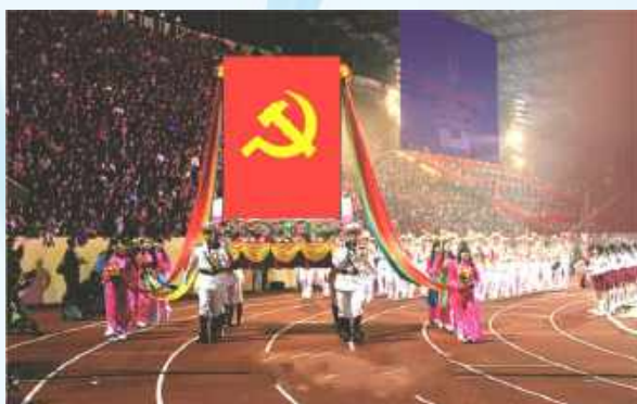
Hình 24c (rước trên kiệu)