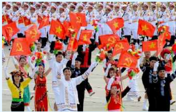
Hình 23d (vẫy bằng tay)