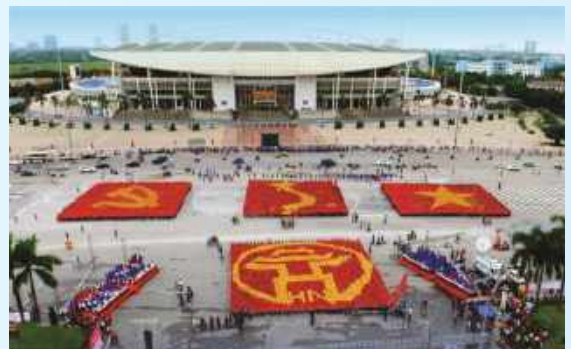
Hình 32 (xếp bằng người)