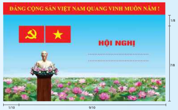
Hình 3a (cờ không tạo sóng)