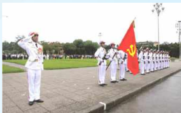
Hình 23b (giương cờ)