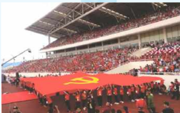
Hình 24a (rước cờ vai)