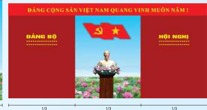
Hình 4a (kích thước hội trường rộng)