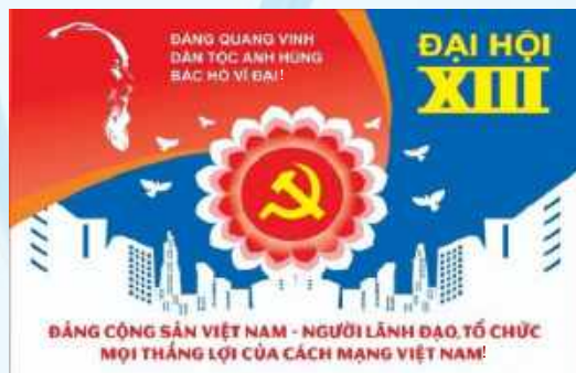
Hình 31b (panô tuyên truyền)