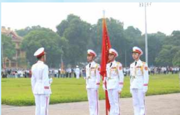
Hình 23a (cầm cờ)