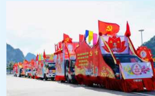
Hình 24d (rước bằng xe)