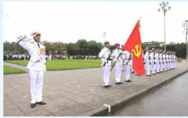
Hình 23b (giương cờ)