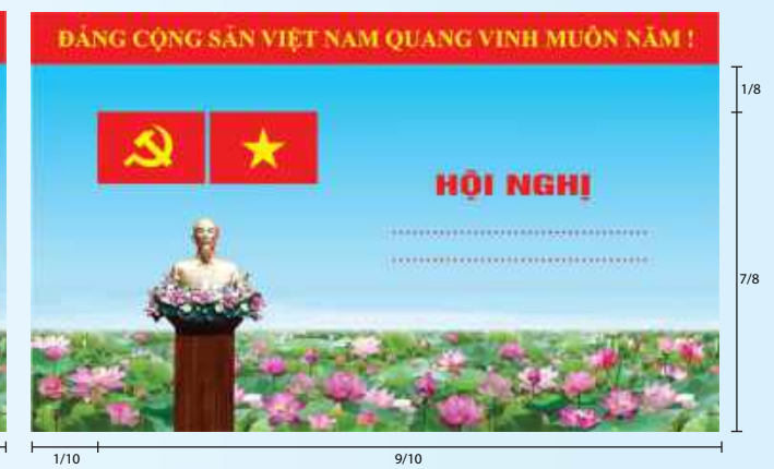
Hình 3a (cờ không tạo sóng)