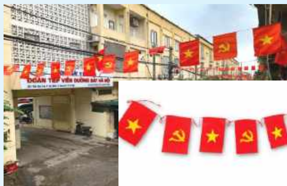
Hình 16b (cờ dây)