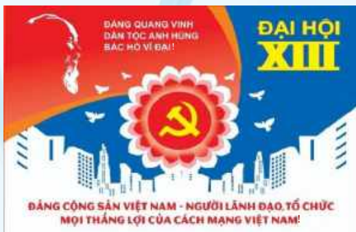
Hình 31b (panô tuyên truyền)