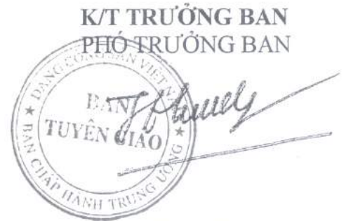
Phan Xuân Thủy