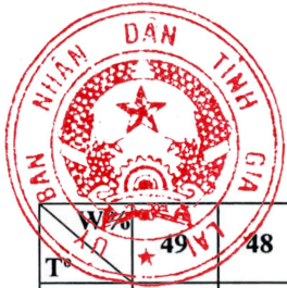
Phụ lục III Bảng tra chỉ số P theo nhiệt độ (từ 2-50°C) và độ ẩm (từ 49-25%) lúc 13 giờ