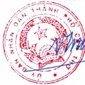
Trần Việt Trường