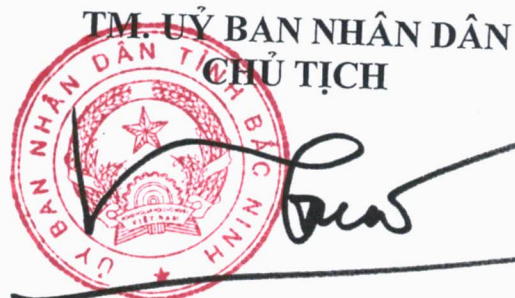
Vương Quốc Tuấn