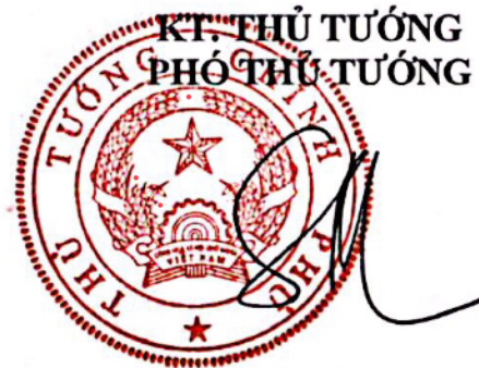
Phạm Bình Minh