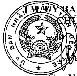
Cao Văn Trọng

2. Trong quá trình thực hiện nếu có vấn đề phát sinh, vướng mắc, khó khăn đề nghị các sở, ngành, đơn vị và các tổ chức, cá nhân kịp thời phản ánh bằng văn bản về Sở Tài nguyên và Môi trường để tổng hợp, nghiên cứu và tham mưu đề xuất trình Ủy ban nhân dân tỉnh xem xét điều chỉnh, bổ sung cho phù hợp./.