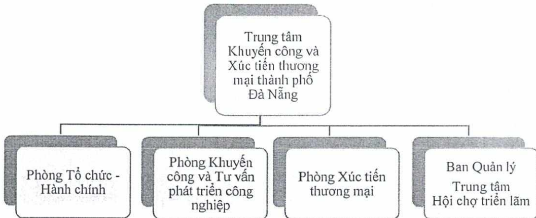
Biểu đồ 1: Cơ cấu tổ chức của Trung tâm Khuyến công và Xúc tiến thương mại thành phố Đà Nẵng (trước khi bổ sung chức năng, nhiệm vụ quản lý CCN)

a) Cơ cấu tổ chức của Trung tâm Khuyến công và Xúc tiến thương mại thành phố Đà Nẵng (trước khi bổ sung chức năng, nhiệm vụ quản lý CCN)