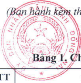
Bảng 1. Chỉ tiêu đối với nguồn nước ngọt nuôi trồng thủy sản

(Ban hành kèm theo Quyết định số 27/2025/QĐ-UBND ngày 19 tháng 3 năm 2025 của Ủy ban nhân dân tỉnh Đồng Nai)