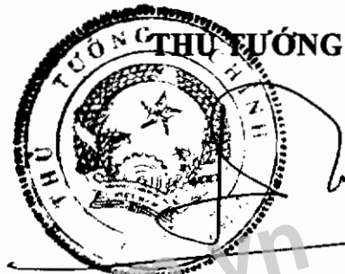
Nguyễn Tấn Dũng

Trong quá trình thực hiện, nếu có khó khăn, vướng mắc, cần kịp thời báo cáo Thủ tướng Chính phủ để chỉ đạo kịp thời./..