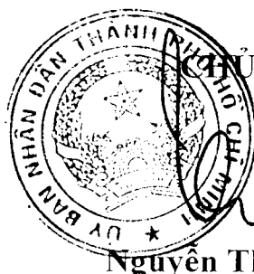
Nguyễn Thành Phong

6. Trong quá trình thực hiện, nếu có khó khăn phát sinh, các đơn vị chủ động báo cáo, đề xuất Chủ tịch Ủy ban nhân dân thành phố (thông qua Văn phòng Ủy ban nhân dân thành phố) để chỉ đạo giải quyết kịp thời./.