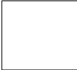
Ảnh chân dung 4 x 6