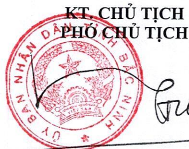
Vương Quốc Tuấn